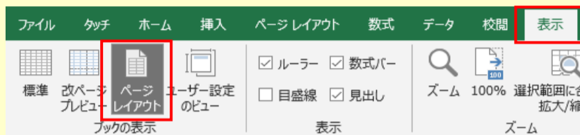
▲表示タブのページレイアウト

「ファイル」タブの「オプション」から「詳細設定」→「表示」欄の「ルーラーの単位」を変更することで、表示する単位を「インチ」や「センチメートル」、「ミリメートル」に変更することができます。